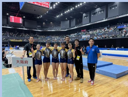
成年女子も健闘・準優勝(35点)に輝きました ♡