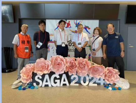
選手団総務の先生方です。 お疲れさまです。