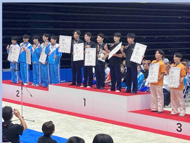
成年男子・堂々の優勝(40点) (27年ぶり3度目)