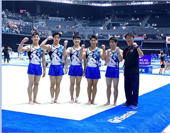
「準優勝・少年男子(35点)」 がんばりましたね！