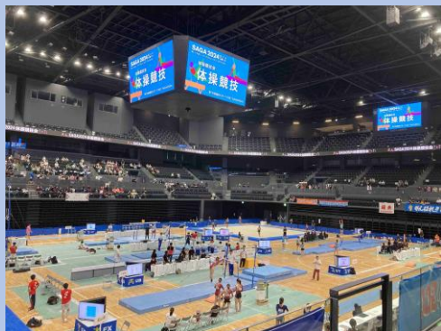
SAGA サンライスパーク SAGA アリーナ