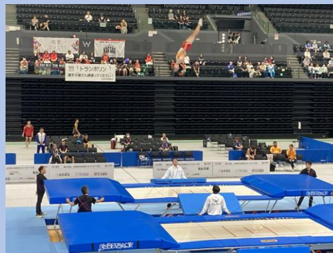
美田選手の予選演技