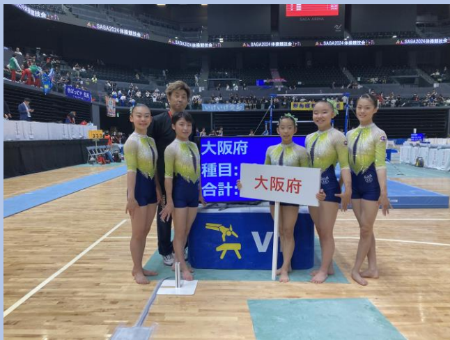
“少年女子は予選2位通過と健闘、 決勝では4位(25点)となりましたが みんな最後までよく頑張りました。”