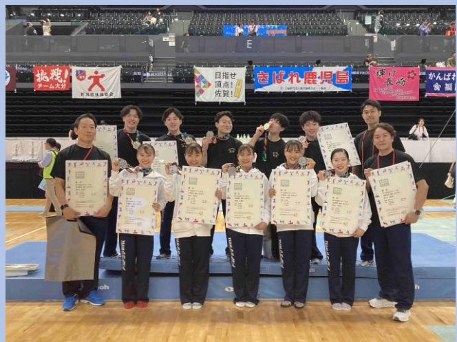
成年男女で男女総合得点 75 点を獲得。